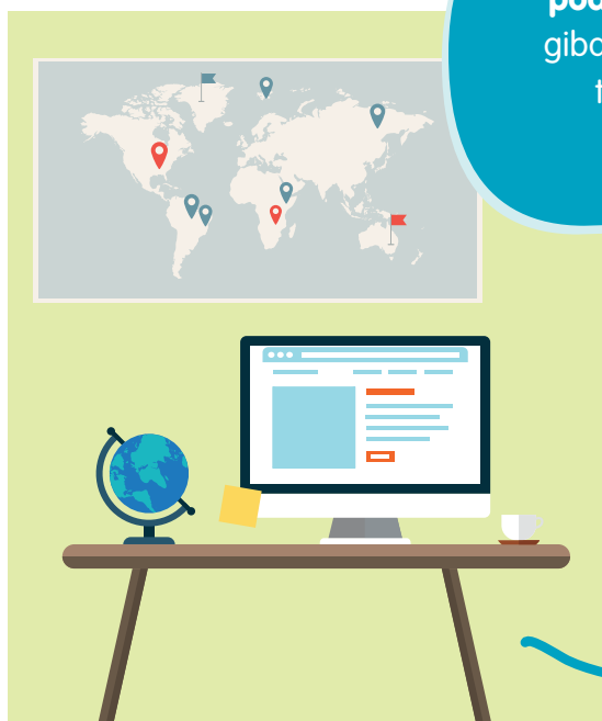
02 ANALIZA PODATKOV

Hidrogeologi raziskujejo podzemno vodo , njeno gibanje in razporeditev v tleh, kamninah in zemeljski skorji.