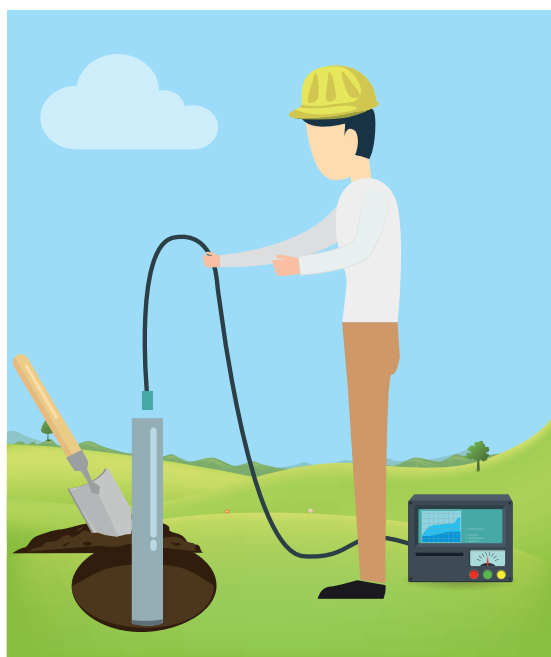
01 TERENSKO DELO