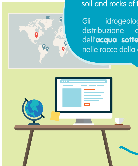
02 DATA ANALYSIS L'ANALISI DEI DATI

Hydrogeologists study the distribution and movement of groundwater in the soil and rocks of the Earth's crust.