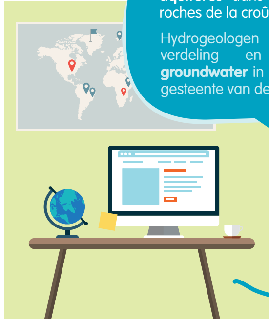
02 L'ANALYSE DES DONNÉES DATA ANALYSE

Les hydrogéologues étudient la distribution et le déplacement des aquifères dans le sol et dans les roches de la croûte terrestre.